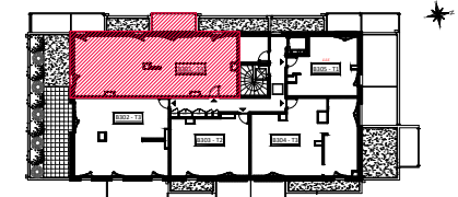
Batiment B NIVEAU R+3